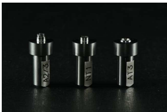
スキャニングホルダー